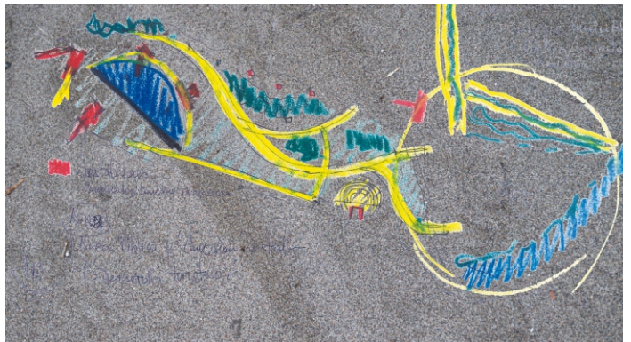
MAINQUE - La Península

La Isla tiene 60 has. y un frente sobre el río Negro de 4 km. Además, está la laguna central con 2,5 km. de perímetro de agua. La base del proyecto está dada por los frentes de agua, de diseño longitudinal, y el bosquecillo natural paralelo a la laguna. En el proyecto público los edificios principales se asientan sobre las costas "eventos, ferias, fiestas populares". En el caso de los deportes acuáticos se dan frente a la laguna, y los desarrollos privados en el semicírculo que se conecta con la isla, en la margen sur, vía boulevard costanero.