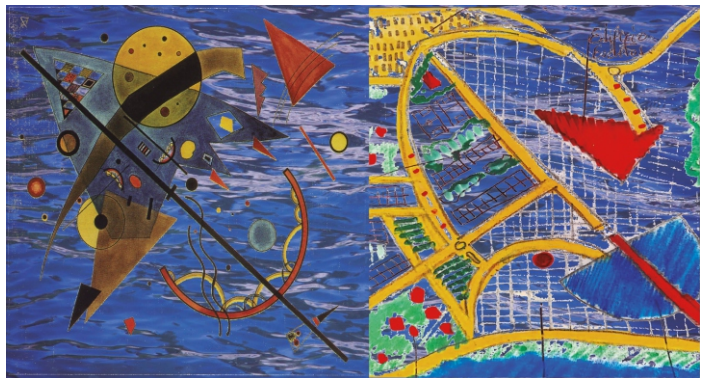
Gral. ROCA I.32 - W. Kandinsky

El proyecto se estructura en una parcela con frente de agua que al río y a una gran laguna artificial con forma de un cuarto de círculo. La base del diseño en planta se corresponde con la obra de V. Kandinsky. El diseño sigue la estructura del terreno semicircular, se recorta la bahía dando un hermoso espacio que será dominante para todas las actividades que se desarrollen en el lugar. Hay un doble prisma cruzado (edificio principal) que se completa con otras piezas geométricas, como el rectángulo paralelo a la bahía (isla de los inventos). El círculo rojo supone el anfiteatro. Todo ello constituye un ámbito de calidad natural y arte.