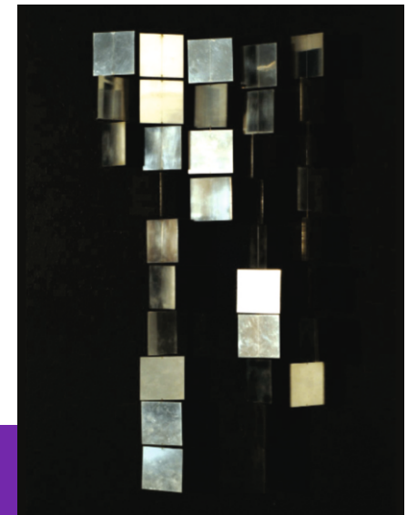
"Estructura cinética en acero - acero sobre aglomerado"

¿Qué materiales necesitarías para construir una obra que produzca el mismo efecto con la luz y el movimiento?