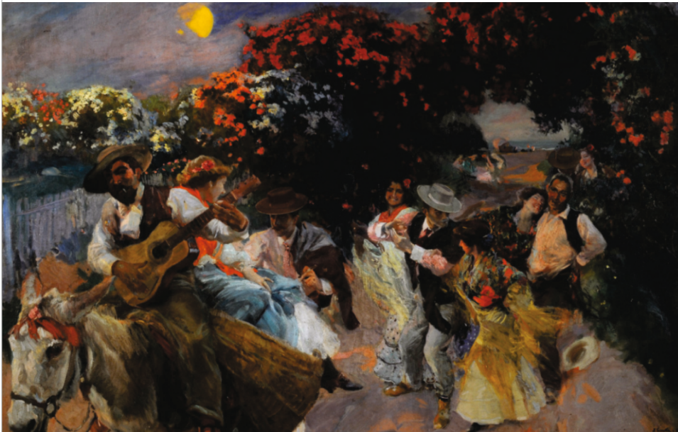
"La última copla" Óleo sobre tela - 100 x 156 cm.

Presta atención a la pincelada y a los cambios de temperatura del color que logran producir efectos de profundidad en el espacio.